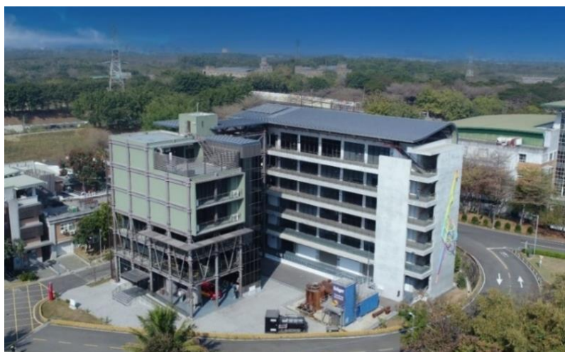
圖 2.1、南區毒化災專業訓練中心