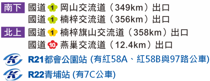
圖 4.1、自行駕車交通路線指引