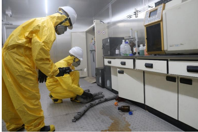
圖 2.3、實驗室災害暨實物偵檢模組訓練概況