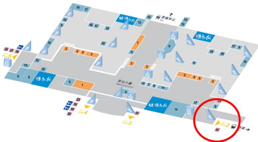
圖 4.2、自行駕車交通路線指引

B. 集合時間： 09:15 ，坐車前往南區毒化災專業訓練中心 (約 25 分鐘)