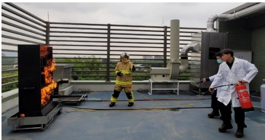
圖 2.2、初期小型火災訓練模組訓練概況

具備產生可控之實火，並可搭配多種不同情境類型模組，包含廢棄物桶、配電盤、泵浦、機台、藥品櫃(圖 2.2)，亦可模擬池火、噴射火焰等燃燒型態，搭配可重複充填式滅水器進行初期小型火災控制訓練。