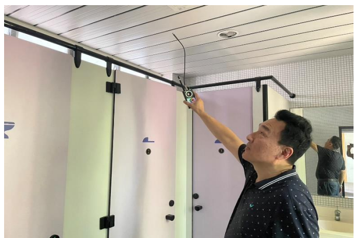
綜合大樓廁所反針孔攝影偵測