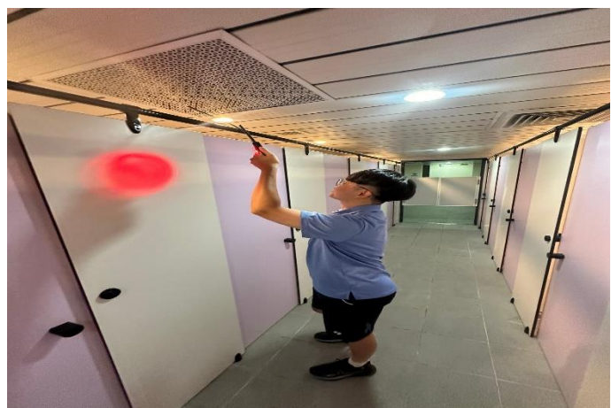
游泳池更衣室反針孔攝影偵測