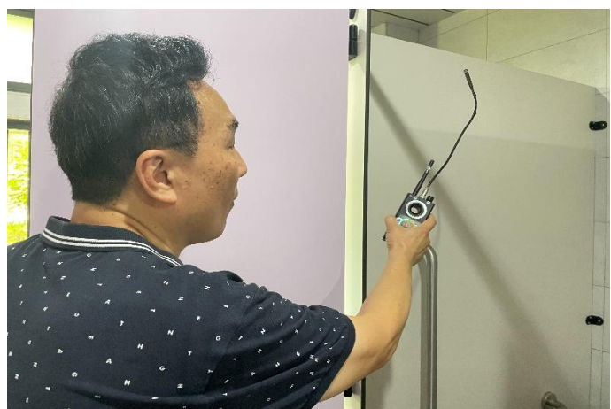
明倫樓廁所反針孔攝影偵測