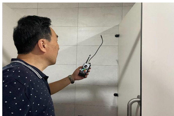
游藝樓廁所反針孔攝影偵測