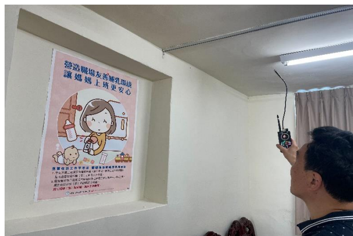
哺乳室反針孔攝影偵測